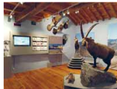
Museo Civico Alpino “A. Tazzetti” - Sala Vette