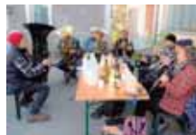
Gruppo musicale tradizionale di Viù